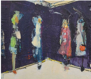
DIRK BEHRENS MISCHTECHNIKEN - Kleinformate

www.stilhaus-magazin.de/workshops office@stilhaus-magazin.de